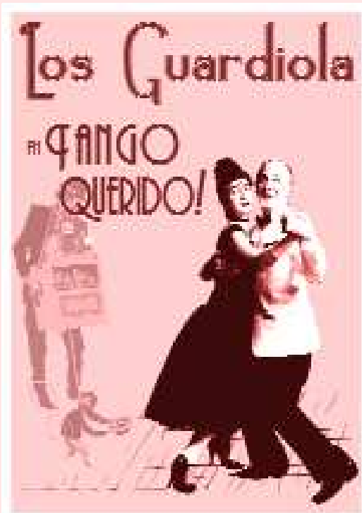
La locandina e alcune foto dello spettacolo

Una parte del estudio del mimo es poner en escena textos, poesías o cuentos mediante el gesto. La forma más adaptada es encontrar un texto de tango que cuente una historia rica de imágenes y acciones. Se crea una partitura de gestos como una coreografía en danza y de apoco se logra contar aquello que se quiere decir. La magia del mimo es hacer visible lo invisible y en este sentido es un arte maravilloso: sin escenografía, objetos y palabra se puede crear un entero universo. Nuestro gesto dibuja la línea y la imaginación del público llena el espacio. El mimo es